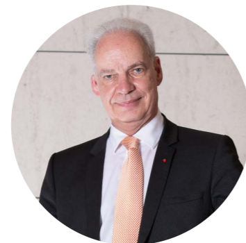
Alain GRISET Ministre délégué auprès du ministre de l'Économie, des Finances et de la Relance, chargé des Petites et Moyennes Entreprises