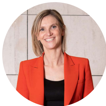
Agnès PANNIER-RUNACHER Ministre déléguée auprès du ministre de l'Économie, des Finances et de la Relance, chargée de l'Industrie