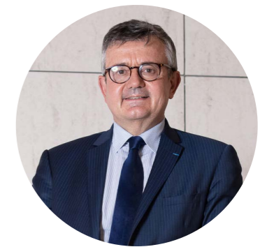
Yves JÉGO Ancien secrétaire d'État à l'Outre-mer et Président de la certification « Origine France Garantie »