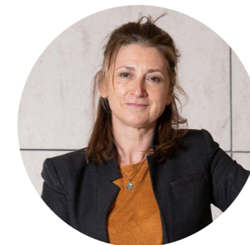
Anne-Laurence PETEL Députée des Bouches-du Rhône, Secrétaire de la Commission des Affaires économiques à l'Assemblée nationale